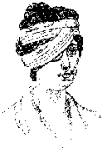
Perception oculaire triple

Bien que sans opinion, je suis souvent de l'avis contraire.