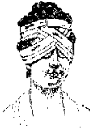
Perception auditive double